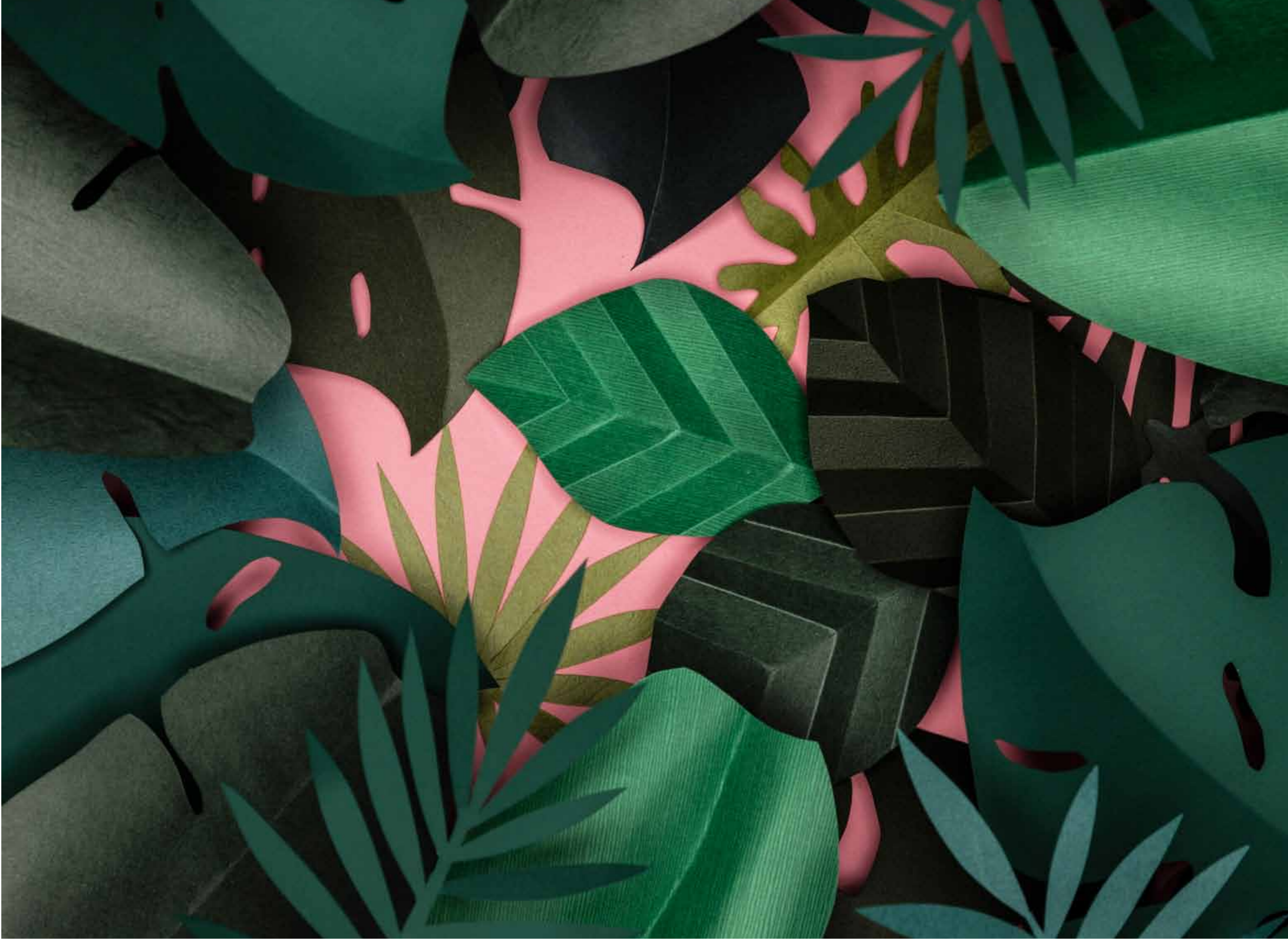
• 스퀘어인더페이퍼, <Paper Forest>, 두성중이의 다양한 컬러 페이퍼에서 '그린' 계열 종이를 선별해 작업했습니다(그문드필리메트 60, 플라이크 248, 디자인너스칼라 D65, 디프메트 125, 비비칼라 22, 타레 33, 티엠보스사간 42, 씨엘칼라 29). • 이 페이지는 양면 인쇄 시 비침이 없고 황변현상이 적은 친환경 용지 '블록키'(퍼펙트화이트 135g/m 2 )에 4도 오프셋 인쇄했습니다.